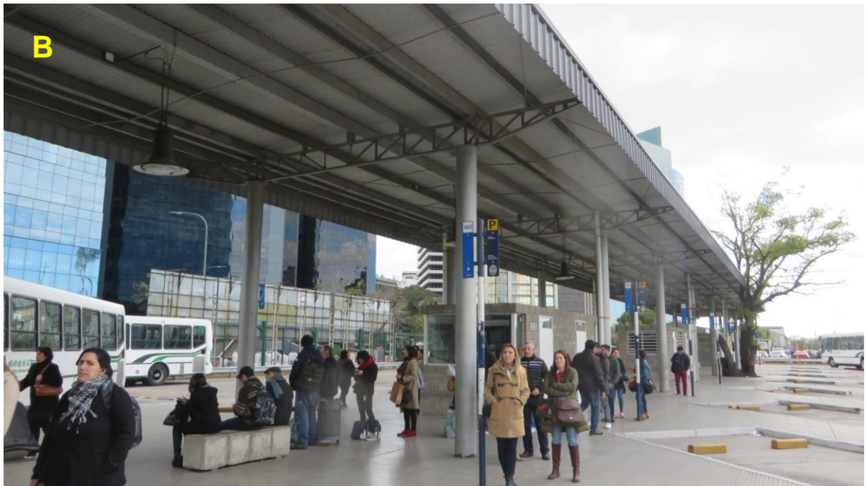
B_Dársenas de colectivos.