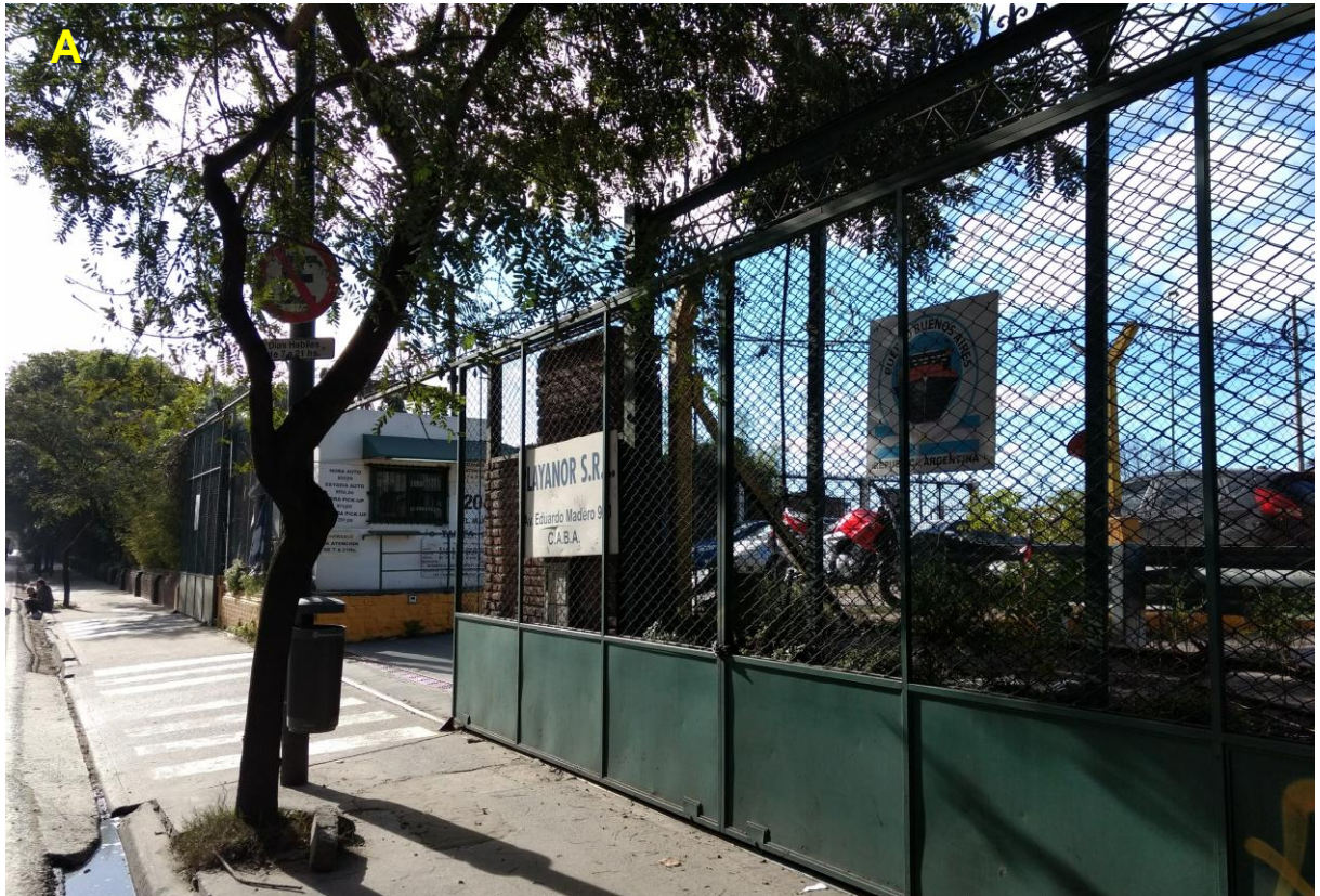
A_Ingreso al estacionamiento sobre Av. Eduardo Madero.