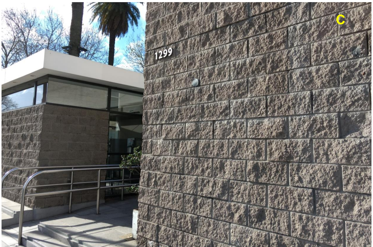
C_Ingreso a la terminal sobre Av. Madero 1299.