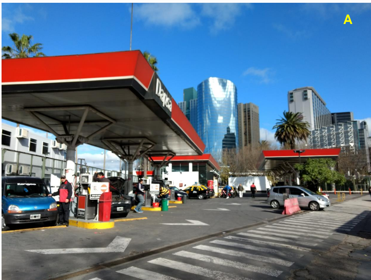
A_Vista de la estación de servicio DAPSA.