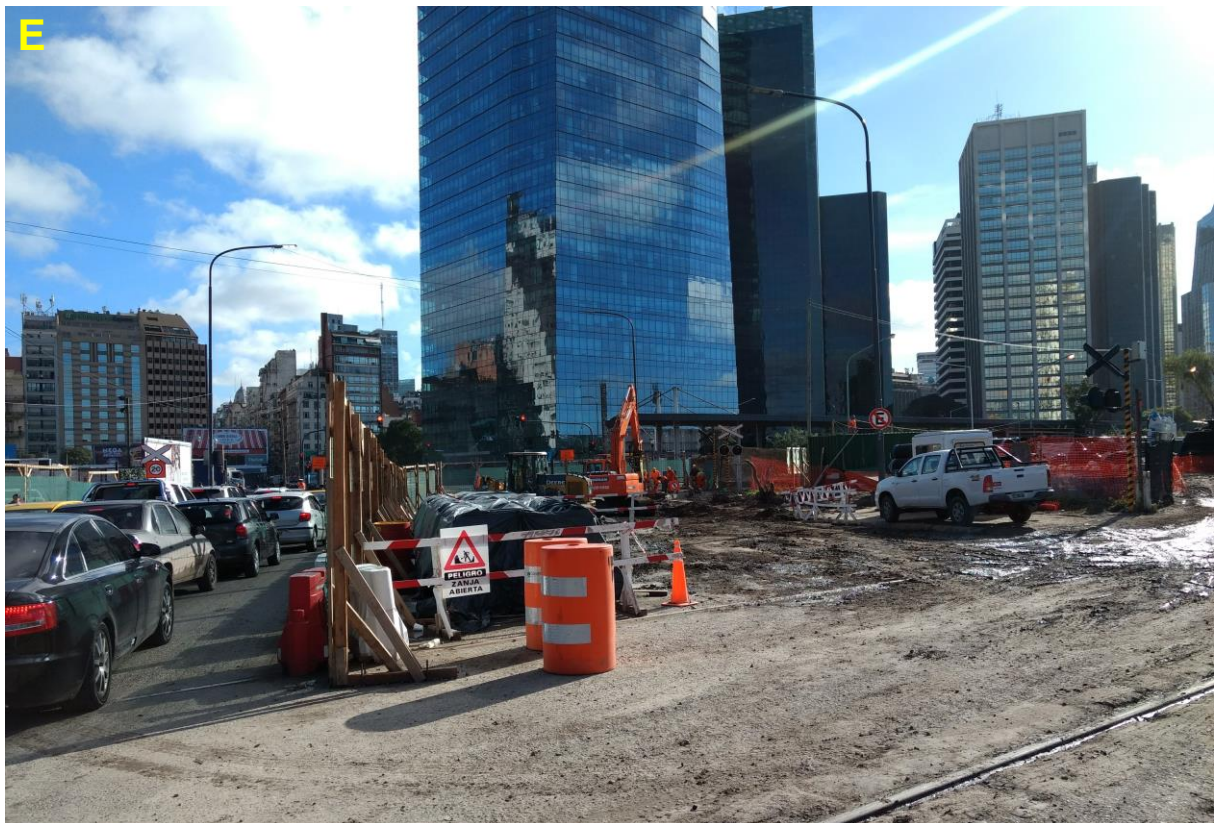
E_Obrador en esquina Cecilia Grierson y Av. Antártida Argentina.