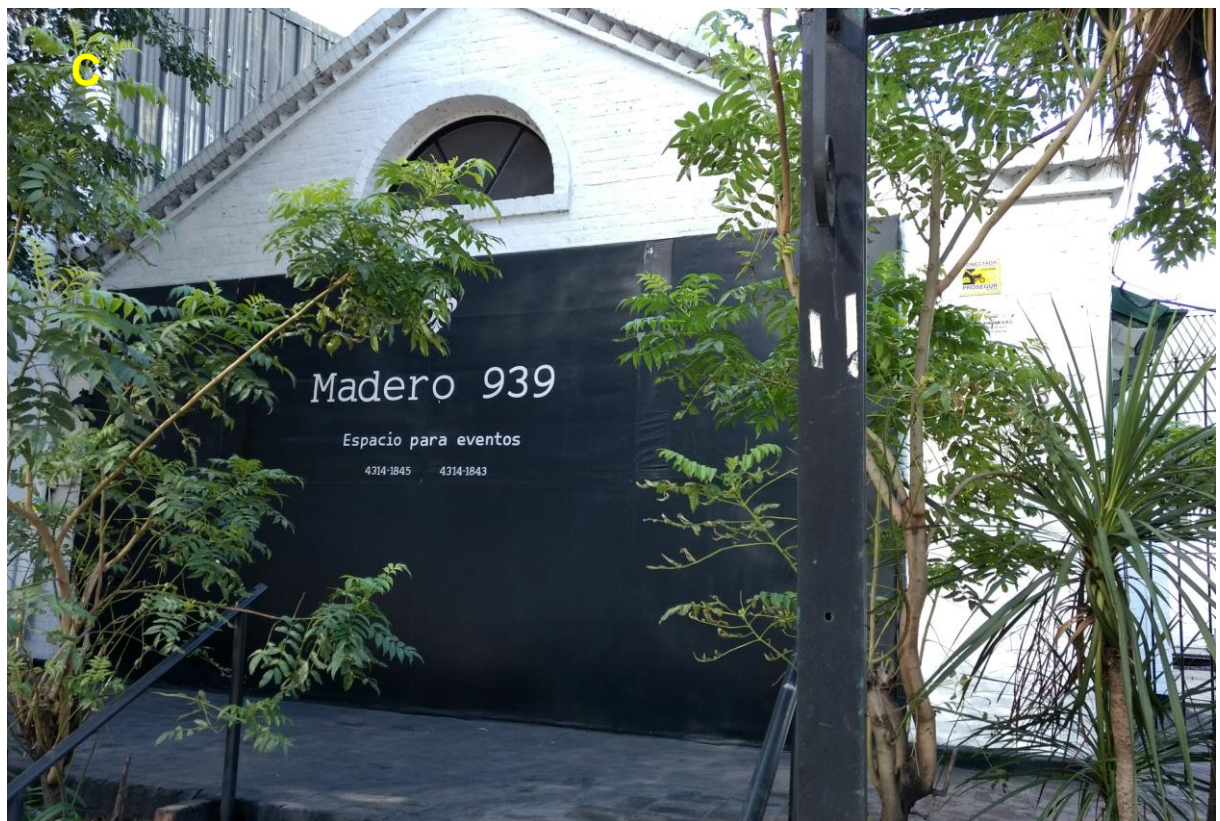
C_Sector de Eventos.