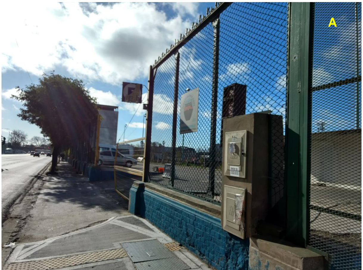
A_Ingreso al estacionamiento.