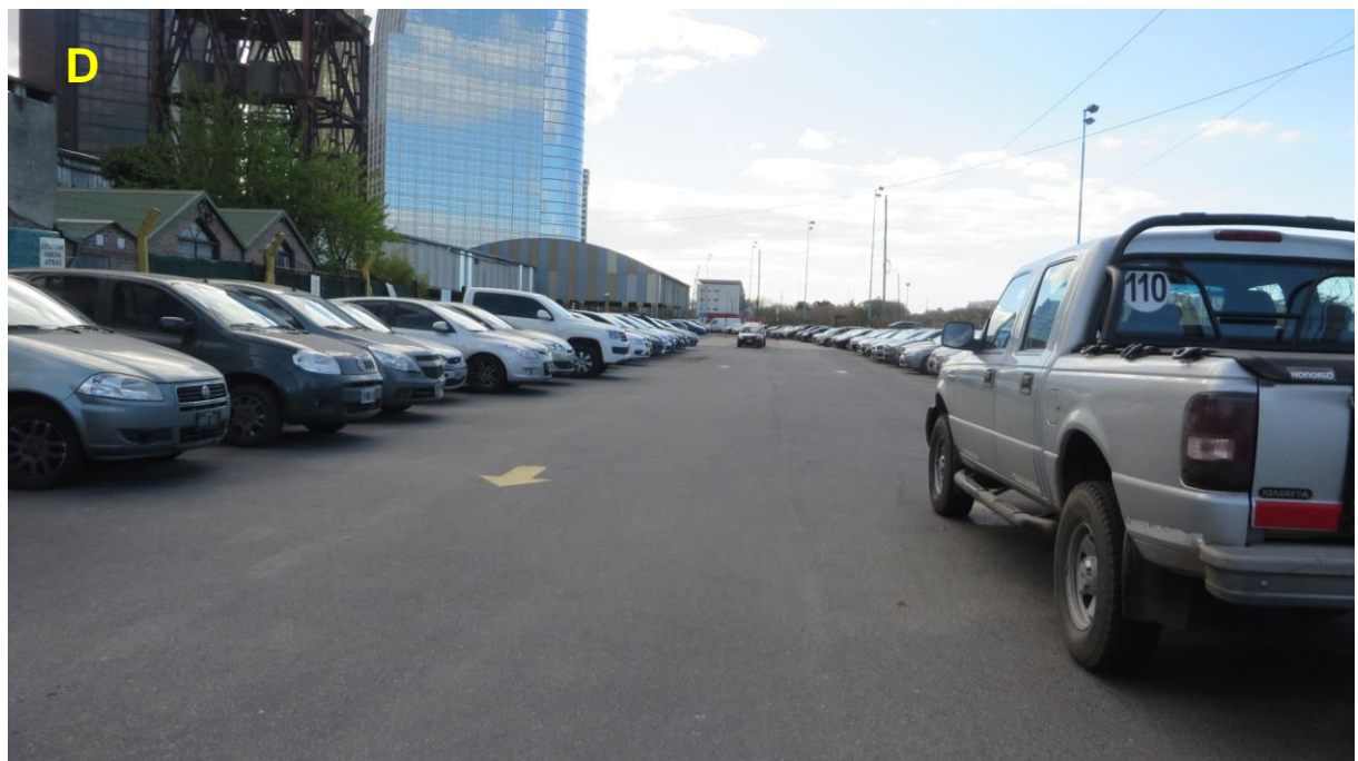
D_Interior del estacionamiento.