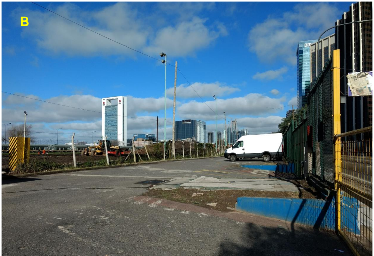
B_Interior del estacionamiento.