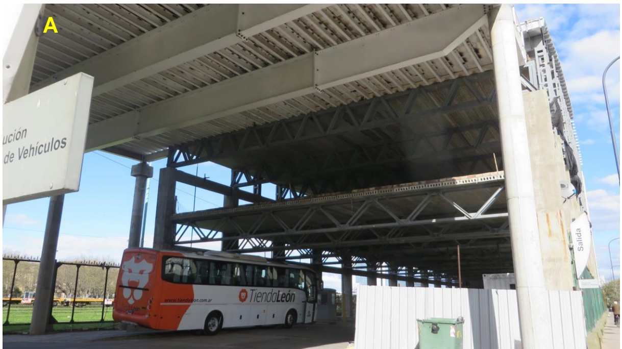
A_Sector nuevo de Manuel Tienda León.