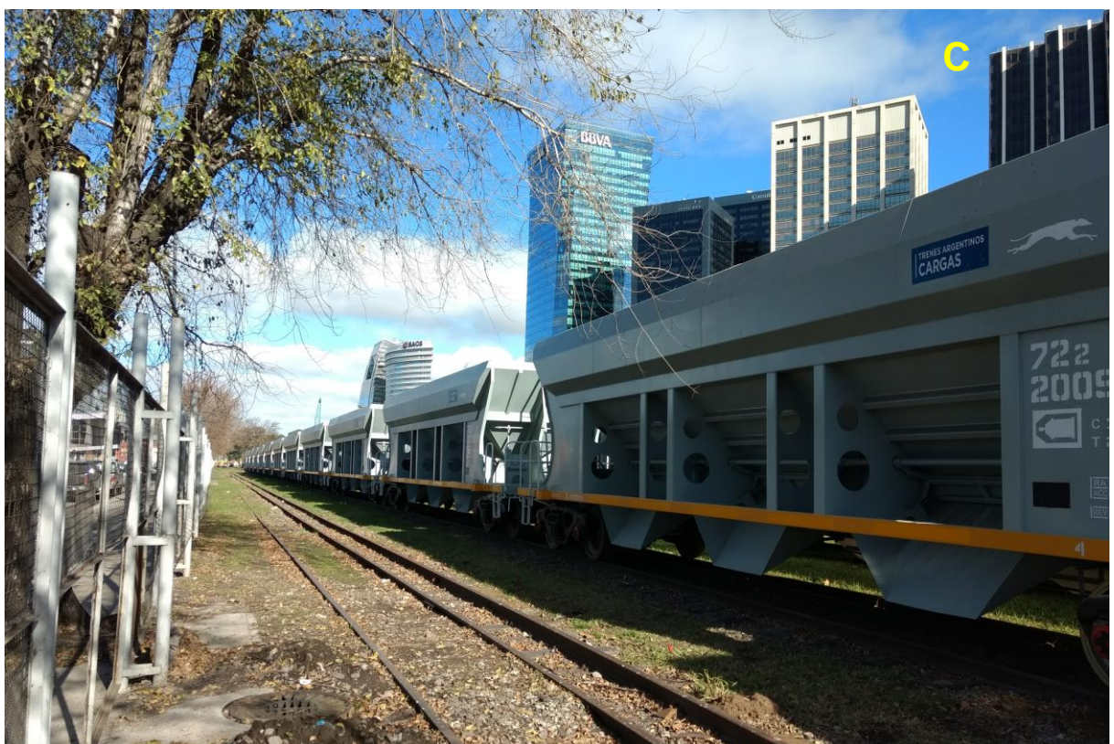
C_Trenes de carga sobre Av. Antártida Argentina.