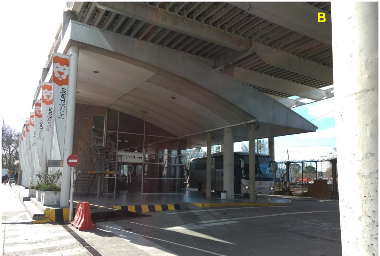
B_Terminal de ómnibus.