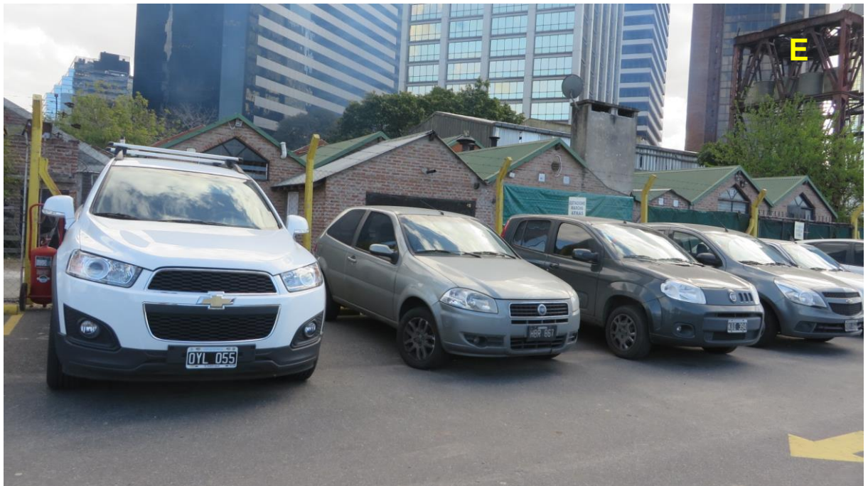
E_Contrafrente del sector de Eventos.