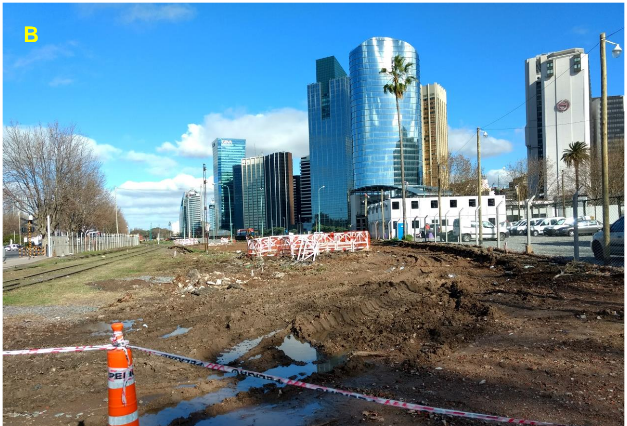
B_Obrador sobre calle San Martín.