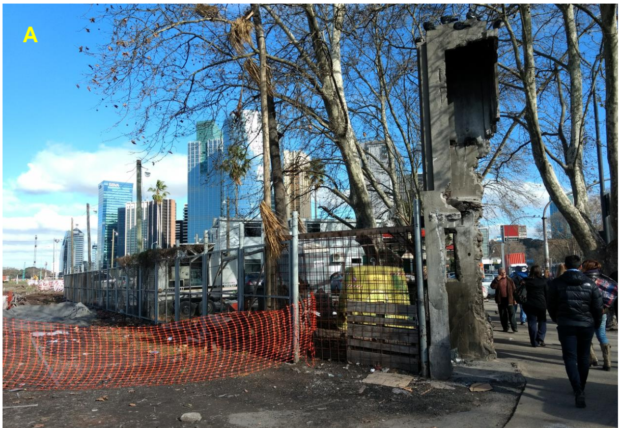
A_Obrador sobre calle San Martín.