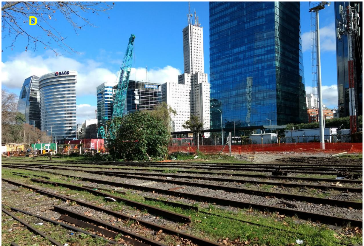
D_Vista del obrador sobre Av. Antártida Argentina.