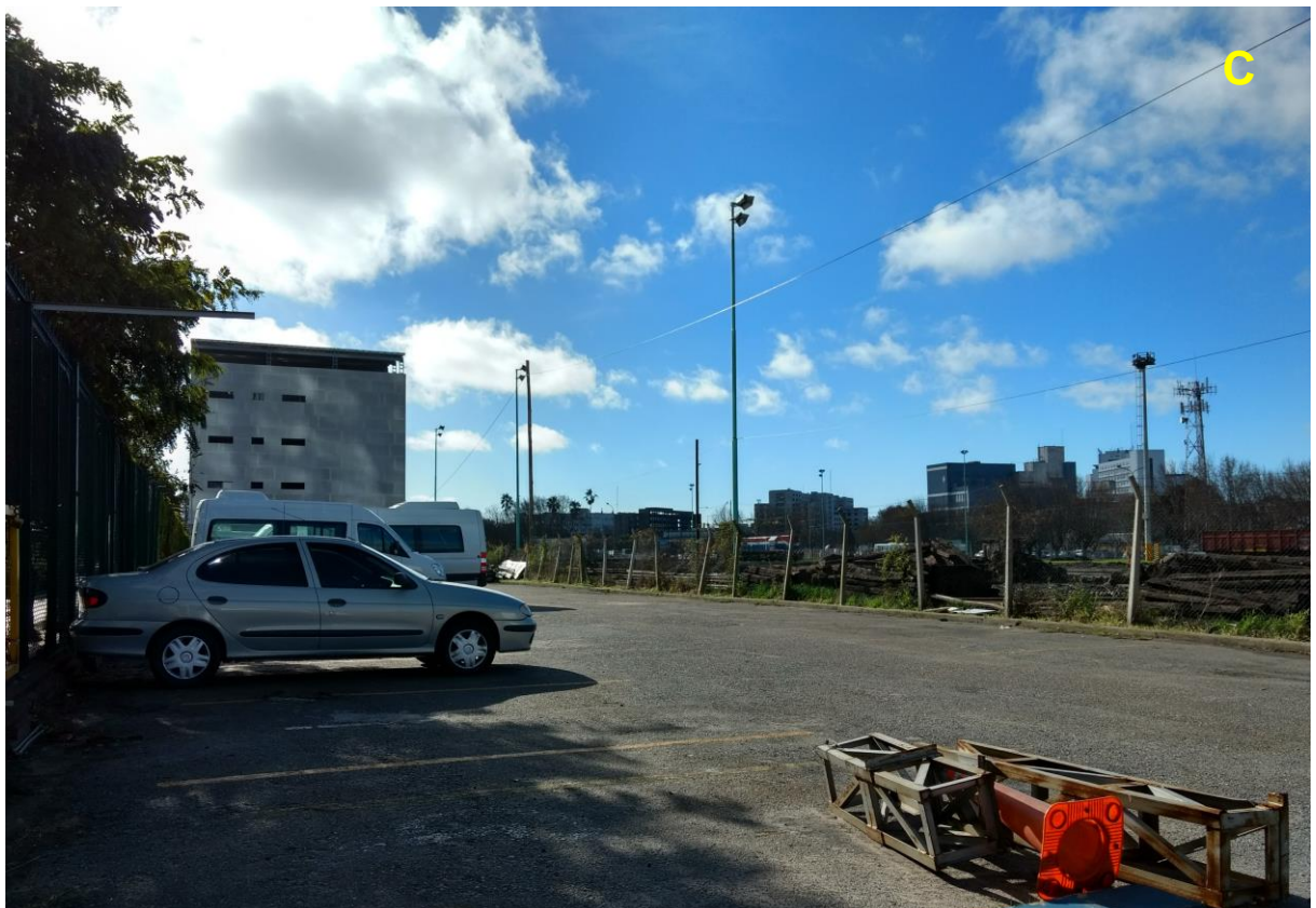
C_Interior del estacionamiento.