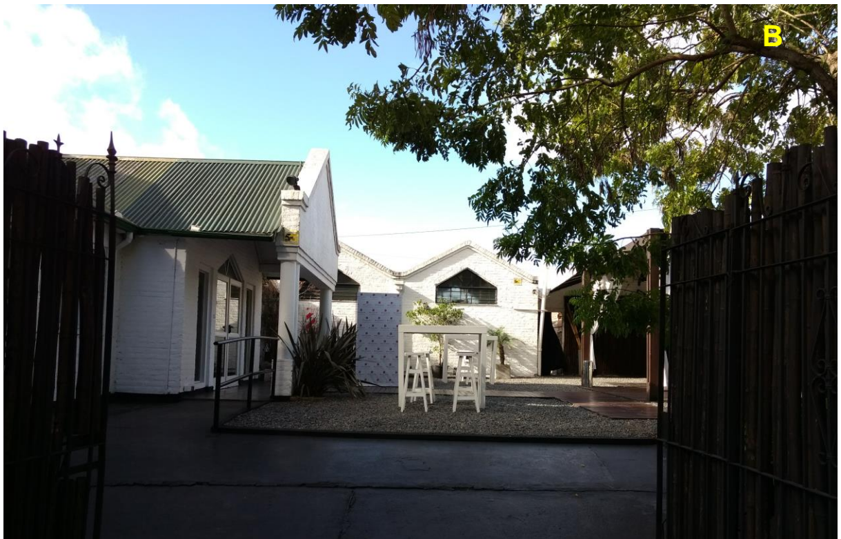
B_Ingreso al sector de venta de comidas sobre Av. Eduardo Madero.