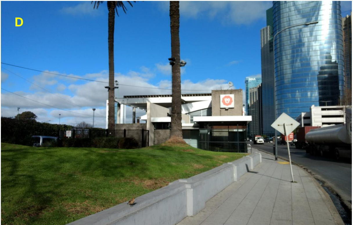
D_Frente de la terminal esquina Av. Madero y San Martín.